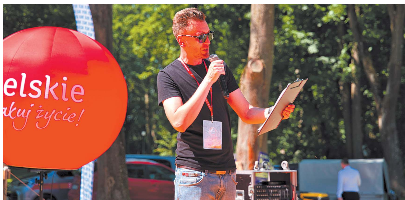
A całość imprezy sprawnie jak zwykle poprowadził nasz redakcyjny kolega Konrad Sołtys, który... zaprasza państwa jeszcze na str. 18