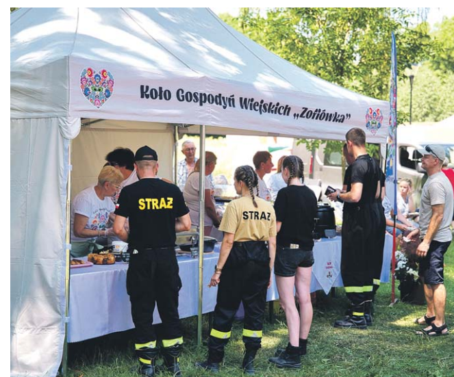
• Dużą popularnością cieszyło się stoisko (a w zasadzie oferta) Koła Gospodyń Wiejskich z Zofiówki. Pyszne było...