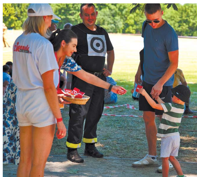
• Nasze redakcyjne hostesy miały pod ręką (a w zasadzie w koszyczku) także ofertę dla najmłodszych uczestników pikniku w Łęcznej