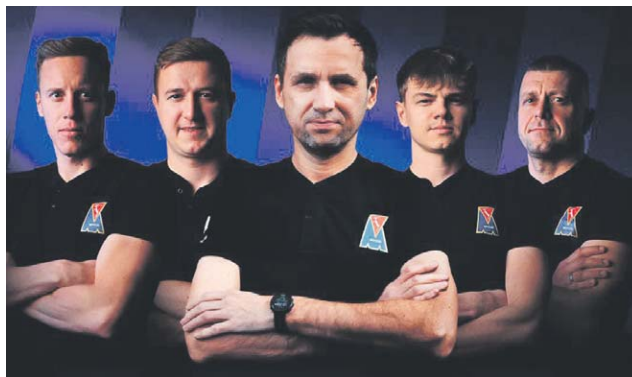
Motor oficjalnie pożegnał kolejnych trenerów, szefa skautingu oraz dyrektora akademii

– Po przepięknych 3,5 roku przyszedł czas na pożegnanie z Motorem Lublin. Jestem