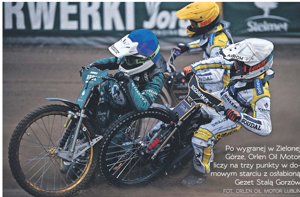
Po wygranej w Zielonej Górze, Orlen Oil Motor liczy na trzy punkty w domowym starciu z osłabioną Gezet Stalą Gorzów FOT. ORLEN OIL MOTOR LUBLIN

Na pewno szkoda, że Australijczyk nie przypomniał się kibicom w Lublinie. W końcu wszyscy zacierali ręce na pojedynkę dwóch najlepszych żużlowców PGE Ekstraligi w tym sezonie. Bartosz Zmarzlik może się pochwalić śred-