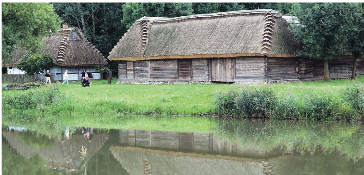
Lubelski Czek Turystyczny coraz bliżej. Wiadomo, kto dostanie 300 zł i kiedy ruszy program

Program nie będzie skierowany wyłącznie do osób spoza województwa lubelskiego. Z przekazanych informacji wynika, że z Lubelskiego Czeku Turystycznego będą mogli skorzystać seniorzy po 60. roku życia, pełnoletni posiadacze Karty Dużej Rodziny, wszyscy peł-