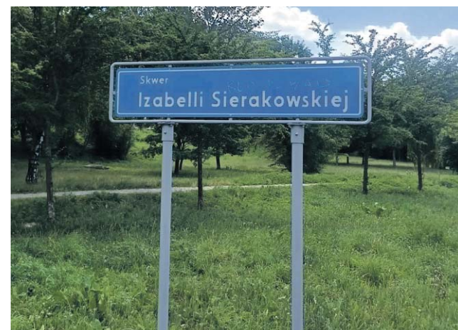
„Red is bad” na skwerze Sierakowskiej. Działacz Nowej Lewicy: Ikona walki o równość