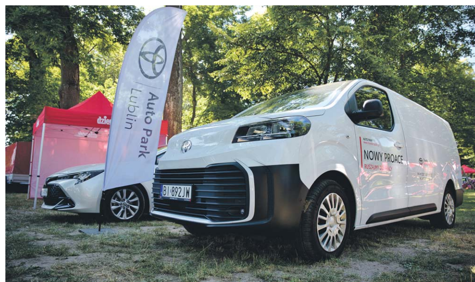
• Naszym partnerem była również Toyota Auto Park, ze swoimi efektownymi autami