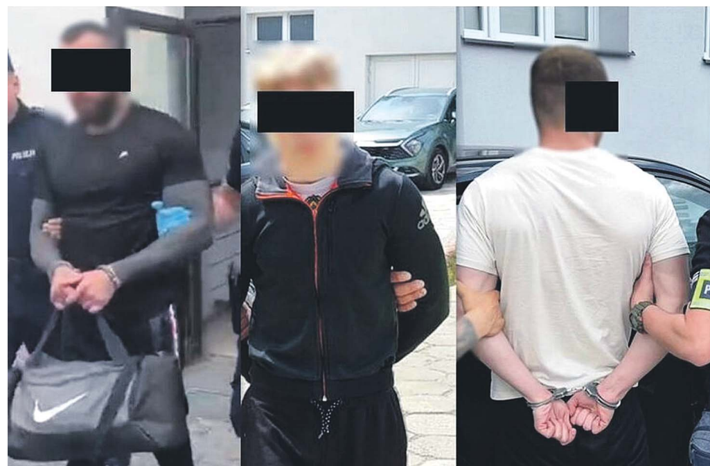
Uciekli z poprawczaka i oszukiwali seniorów. Policja rozbiła grupę działającą metodą „na legendę”