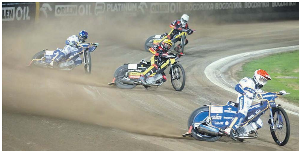
Platinum Motor Lublin pokonał na swoim torze Spartę Betard Wrocław różnicą 12 punktów

Wydawało się, że po tak piorunującym początku sprawa zwycięstwa, w dodat-