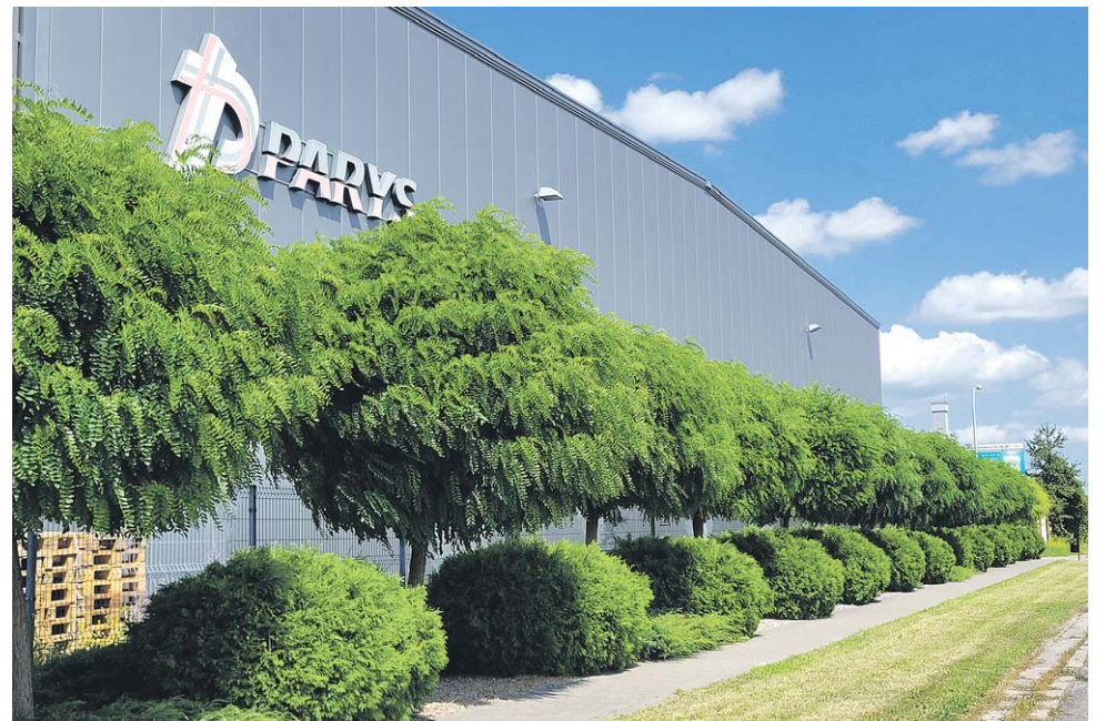
Efektowny szpaler drzew i krzewów na ulicy wzdłuż magazynu firmy Parys na ul. Walentynowicz