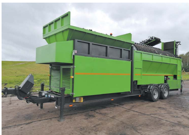
Realizacja zadania pn. Dostawa fabrycznie nowego mobilnego przesiewacza bębnowego

Wykonawca, w umownym terminie, dostarczył Przedsiębiorstwu Usług i Inżynierii Komunalnej Sp. z o.o. z siedzibą w Łukowie fabrycznie nowy mobilny przesiewacz bębnowy do przesiewania frakcji kompostowej osadów ściekowych oraz materiału strukturalnego, niezbędny do przeprowadzenia procesu kompostowania komunalnych osadów ściekowych.