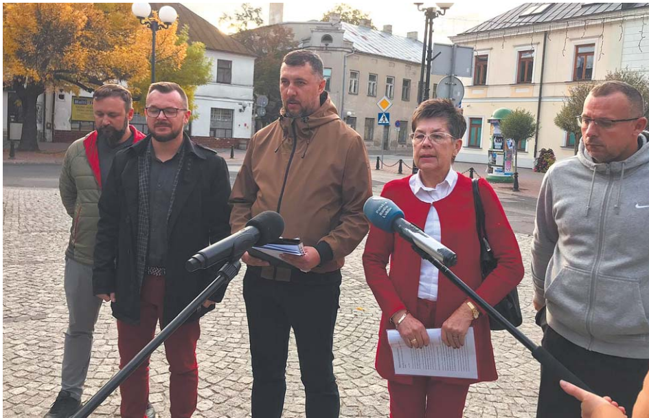
Radni KO chcą uchylić Samorządową Kartę Praw Rodzin