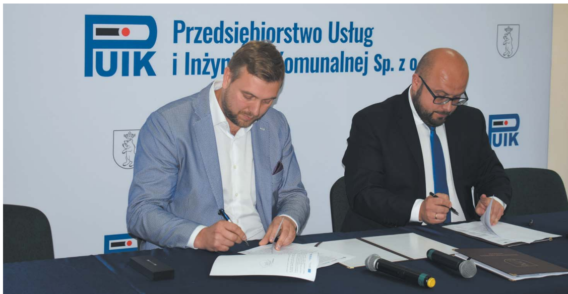
Podpisanie umowy z GSG Industria sp. z o.o. na zadanie Sieć kanalizacyjna – modernizacja Część 2