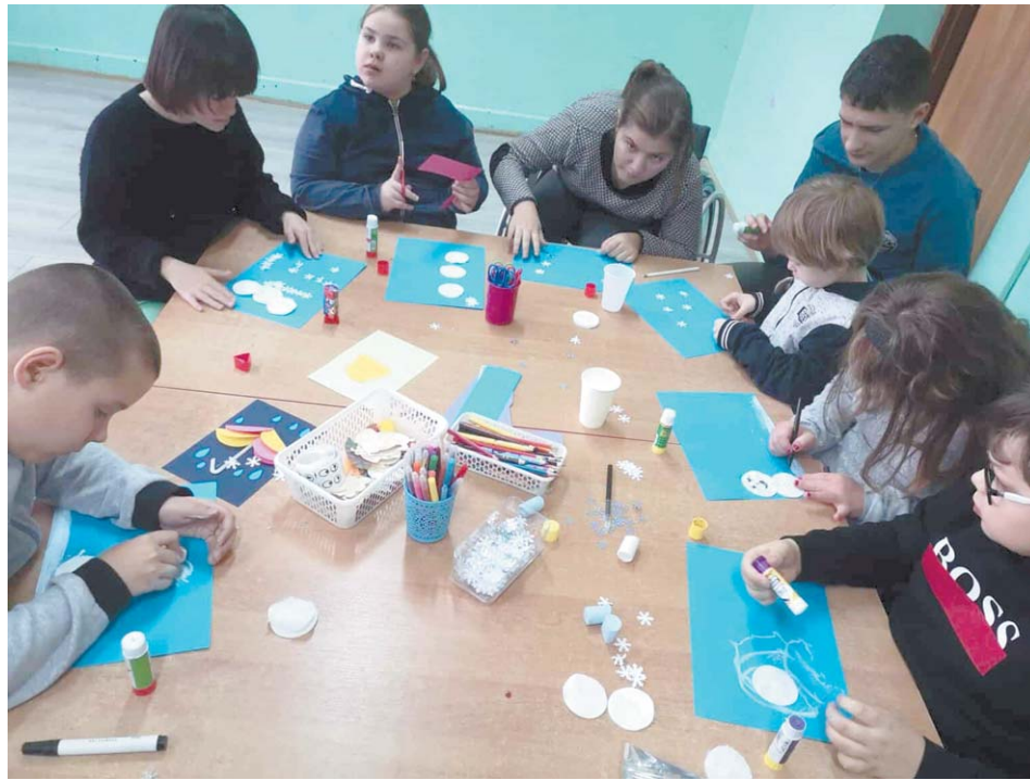
Fundacja Victor pomaga dzieciom niepełnosprawnym. Potrzebuje siedziby

Okazuje się, że zarząd województwa ma już innego chętnego na ten budynek. „Zainteresowanie wyraził dyrektor Szpitala Neuropsychiatrycznego im. profesora Mieczysława Kaczyńskiego w Lublinie,