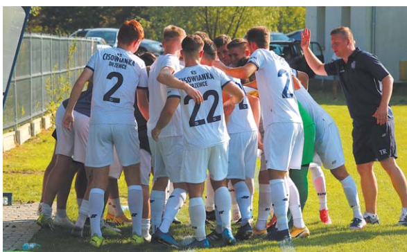
Piłkarze KS Cisowianka Drzewce są liderem lubelskiej klasy okręgowej