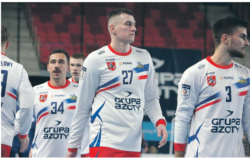
Drużyna Azotów Puławy wróciła do zajęć po świąteczno-noworocznej przerwie