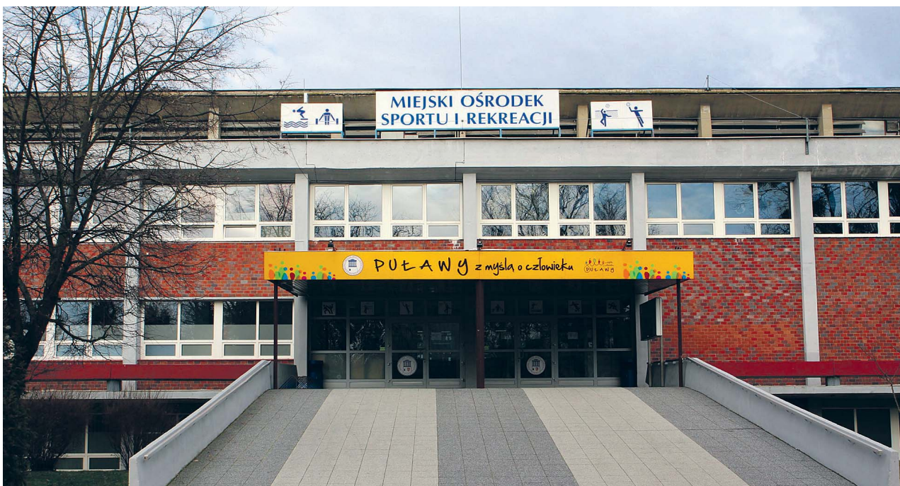
Hala sportowa z 1974 roku wymaga coraz pilniejszego remontu. W grę wchodzi także rozbiórka całego budynku lub przekazanie go pod opiekę zewnętrznemu podmiotowi. Decyzji co dalej na razie brak

Według kontrolerów należy m.in. wymienić całe pokrycie dachu oraz wszystkie okna, przeprowadzić kapitalny remont schodów wejściowych, a konstrukcje stalowe – zwłaszcza nad pływalnią – zabezpieczyć przez korozję. To nie wszystko. Wymieniona na nową, zgodnie z wynikami kontroli, powinna być także instalacja elektryczna. Gdyby nie jej „doraźna modernizacja” przez miejskich elektryków, cały obiekt prawdopodobnie