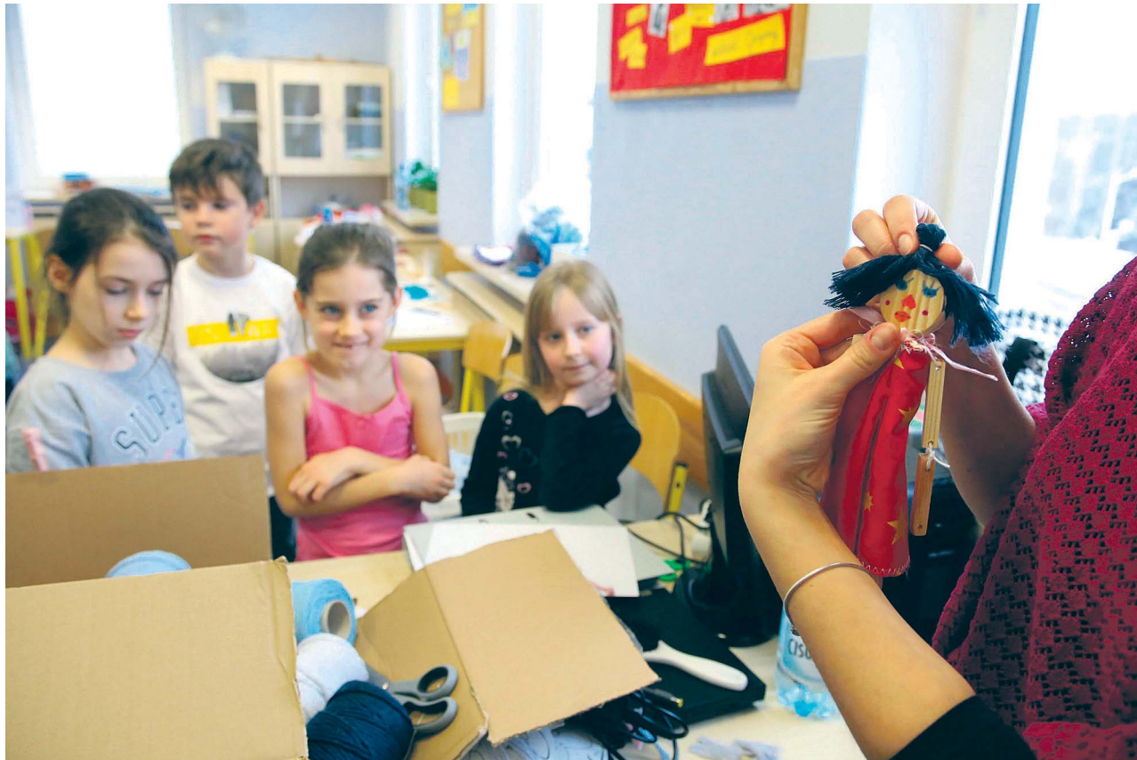
Tak jak rok temu, tak i teraz w ofercie „Zima w mieście” nie brakuje ciekawych warsztatów i zajęć

Młodzieżowy Dom Kultury „Pod Akacją” zaprasza na zimowe warsztaty artystyczne