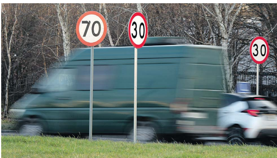
Od dziś na al. Witosa nie obowiązuje ograniczenie do 30 km/h. Ale może wrócić przy gorzej pogodzie

Jak pisaliśmy, od ronda pod Zamkiem aż do wysokości Centrum Handlowego Felicity wprowadzono ograniczenie prędkości do 30 km/h. Normalnie tą trasą można jechać 50 i 70 km/h, ale zima – zmienna tempera-